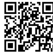
オープンキャンパス申込フォーム QR コード

【申込先】Tel 0585-45-2220 Fax 0585-45-0188 http://www.sunvi-college.jp/